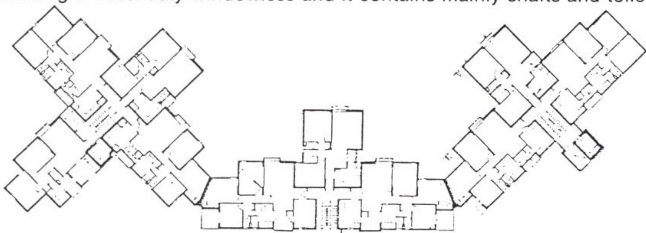
בנין רב-קומות — קומה טיפוסית HIGH RISE BUILDING — TYPICAL FLOOR

1. ELEMENTARY SCHOOL-BOYS 2. ELEMENTARY SCHOOL-GIRLS 3. VOCATIONAL HIGH SCHOOL AND GIRLS SEMINARY 4. BOARDING SCHOOL FOR GIRLS 5. SYNAGOGUE AND COMMUNITY CENTER 6. BRIDGE 7. HIGH-RISE BUILDING 8. LOW BUILDING 9. YESHIVA 10. VOCATIONAL YESHIVA PLUS BOARDING SCHOOL 11. EXISTING DWELLINGS 12. EXISTING INSTITUE 13. DAY CARE AND CENTER FOR BABIES AND NURSING MOTHERS.