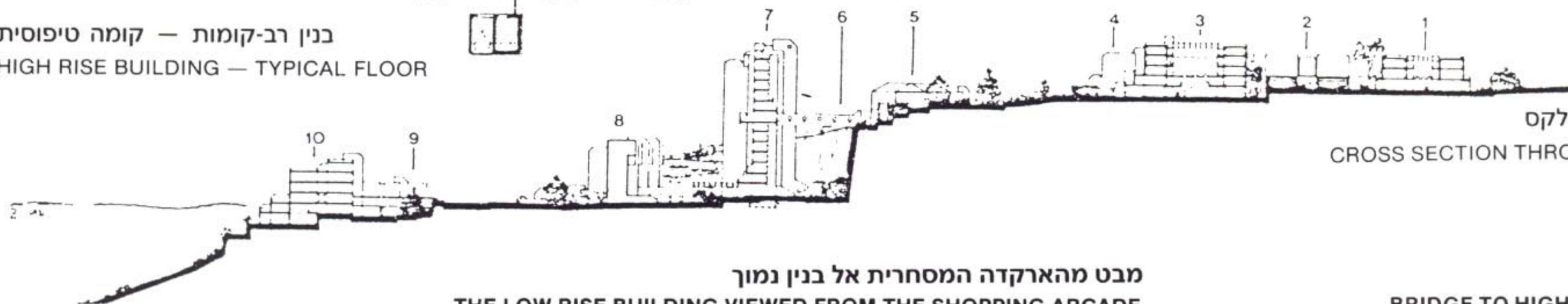
תתך דרך הקומפלקס CROSS SECTION THROUGH COMPLEX