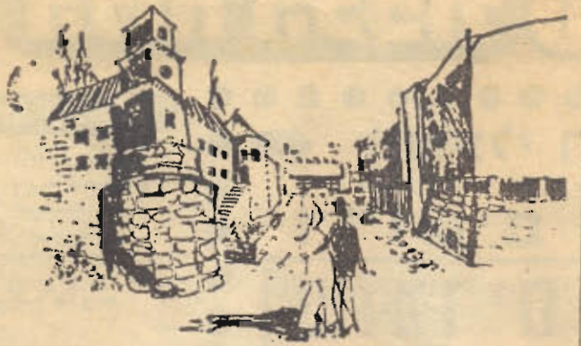
הכניסה למרכז, מוצר הפראיזה (משמאל)