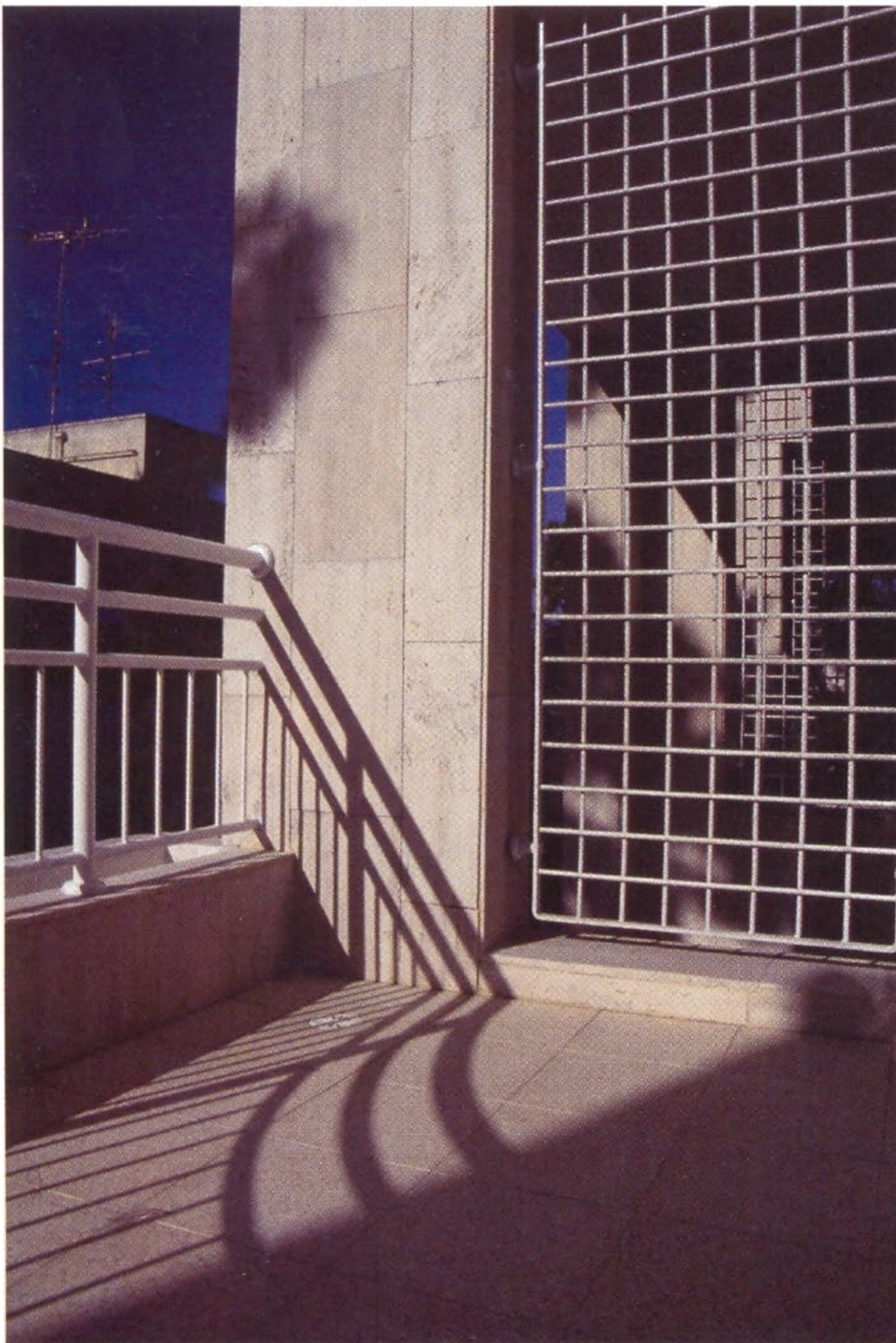
פרט מעקה ו"משרביה"

התאימו לסביבתו - זאת, בין השאר, ע"י התאמת אלמנטים צורניים מקומיים מעקות, פרגולות בנויות ו"משרביות", ועיצובם בשפה אדריכלית מעודכנת. שומת לב הוקדשה לקשר בין הרחוב לכניסה על ידי יצירת רחבת כניסה משולבת במדרכה. בניין תוכנן בשנת 1990, ובוצע ע"י חברת יתיר להנדסה ובניין בע"מ.