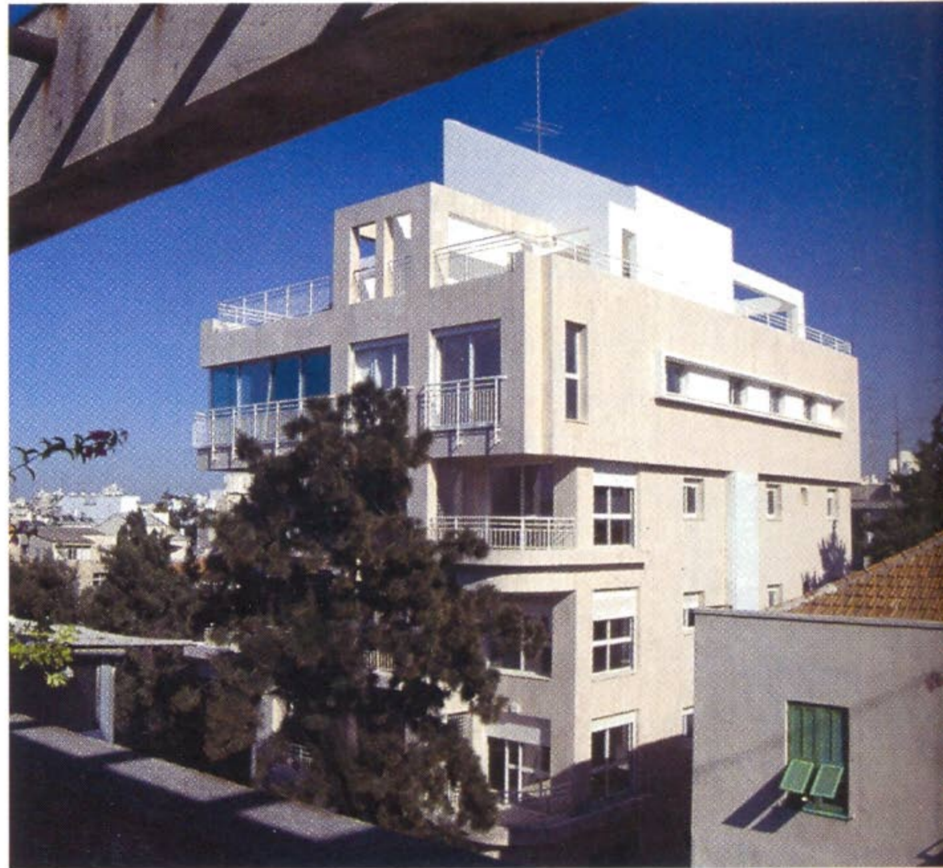
בט דרך פרגולה של בית ממול

התאימו לסביבתו - זאת, בין השאר, ע"י התאמת אלמנטים צורניים מקומיים מעקות, פרגולות בנויות ו"משרביות", ועיצובם בשפה אדריכלית מעודכנת. שומת לב הוקדשה לקשר בין הרחוב לכניסה על ידי יצירת רחבת כניסה משולבת במדרכה. בניין תוכנן בשנת 1990, ובוצע ע"י חברת יתיר להנדסה ובניין בע"מ.